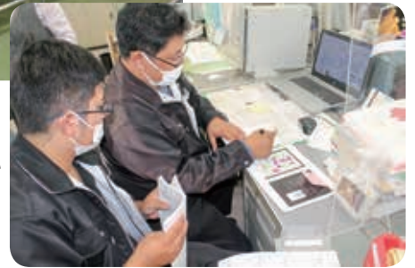
(右)新しいパッケージデザインの検討をしています。