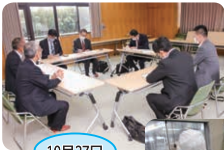
(左)全農と輸出に向けての検討を行っています。