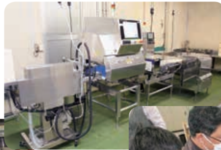
(左)ここで袋への印字や袋口の結束を行います。中央に見えるのがX線探知機や金属探知機になります。