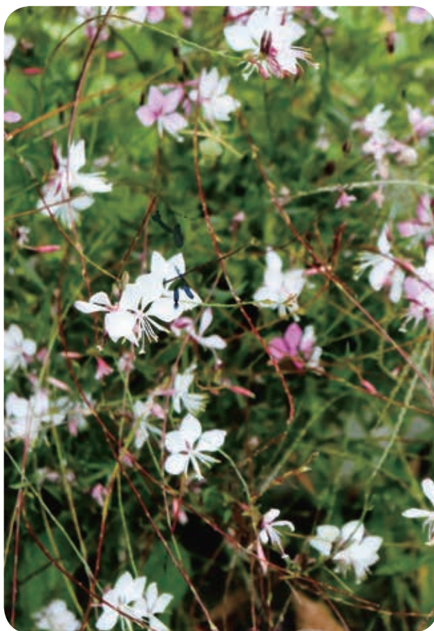
クサハナビ (スベリヒユ科)

去年、不動ヶ岡の友達から鉢植えのクサハナビを頂きました。友達は、9月頃には、花は終わったそうです。家では11月になっても、まだ色あせることなく咲いています。