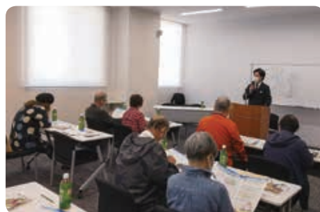
講師の説明を真剣に聞き入る参加者

農中信託銀行の専門員を講師として、相続の基本情報から節税対策、遺言書の必要性や書き方、注意点の解説がありました。参加者は真剣な眼差しで、資料にメモを取りながら講師の解説に聞き入っていました。