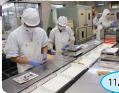
(右)新しい袋詰めのラインです。